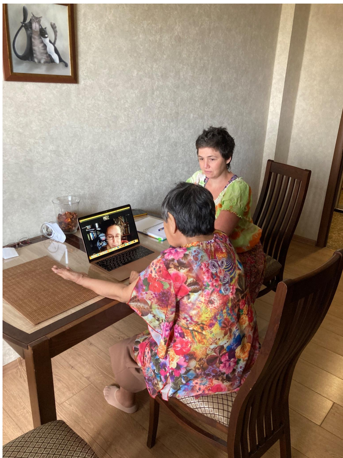
Санкт-Петербург — Краснодар